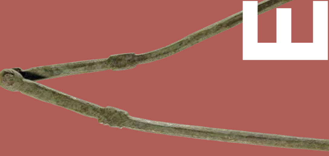
Compás de bronce