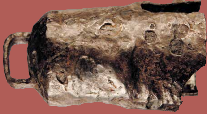
Choca ou cinzarru de ferro