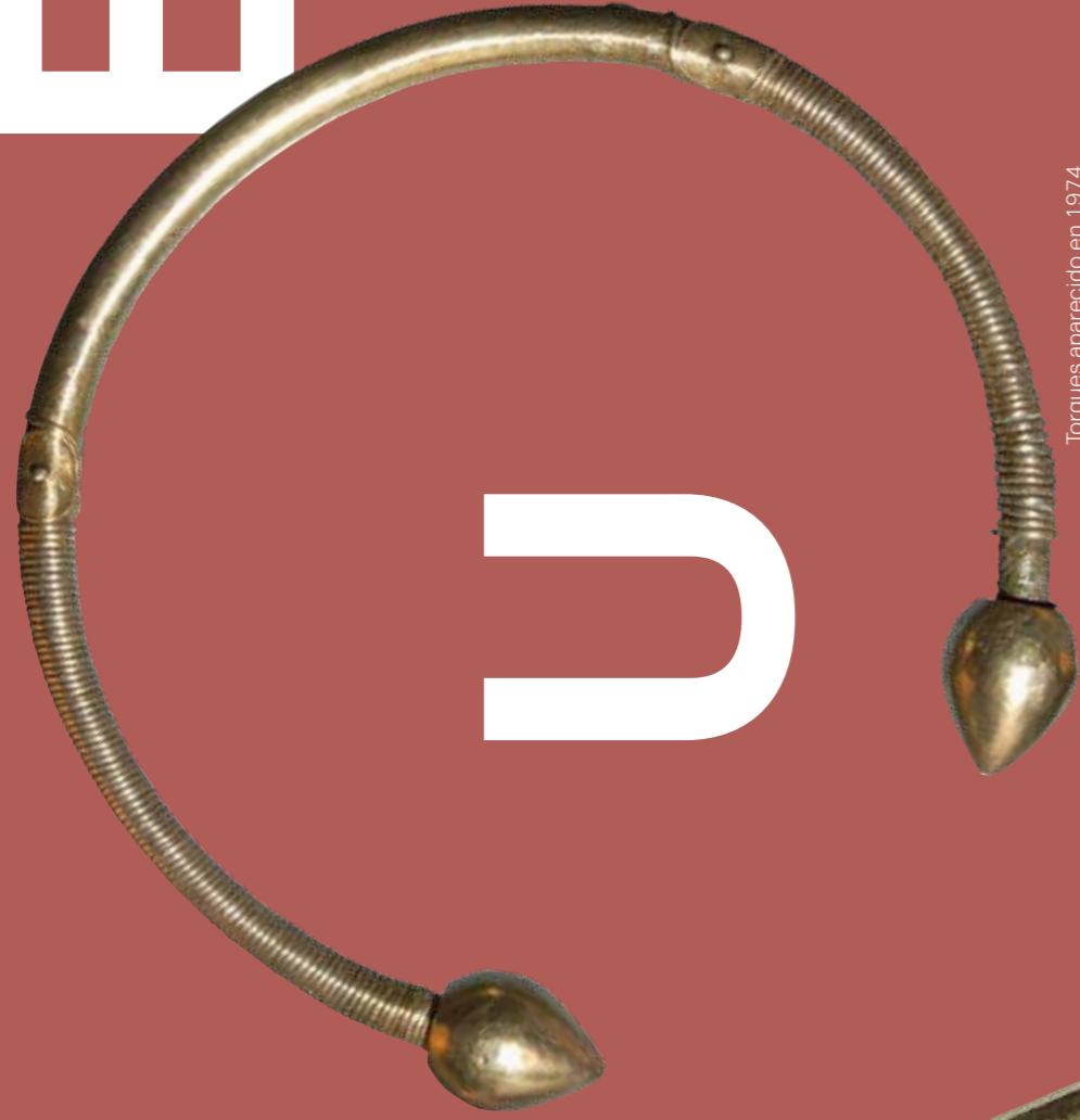
Torques aparecido en 1974