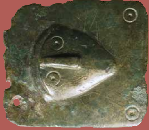
Aplique de bronce con cabeza humana