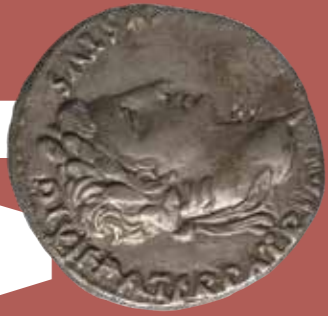
Denario de prata de Augusto (Anverso)