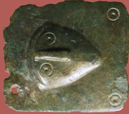
Aplique de bronce con cabeza humana