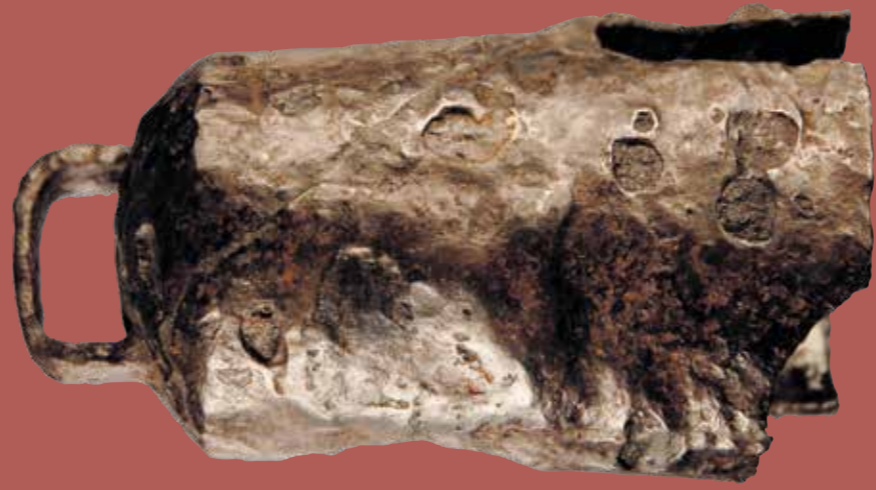
Cencerro de hierro