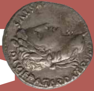
Denario de plata de Augusto (Anverso)