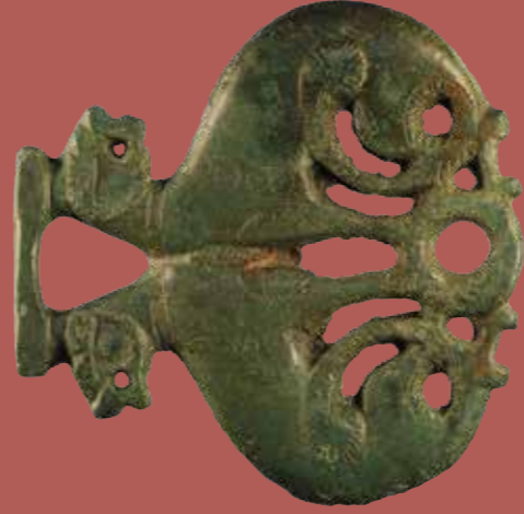
Cama de bocado de freno de caballo