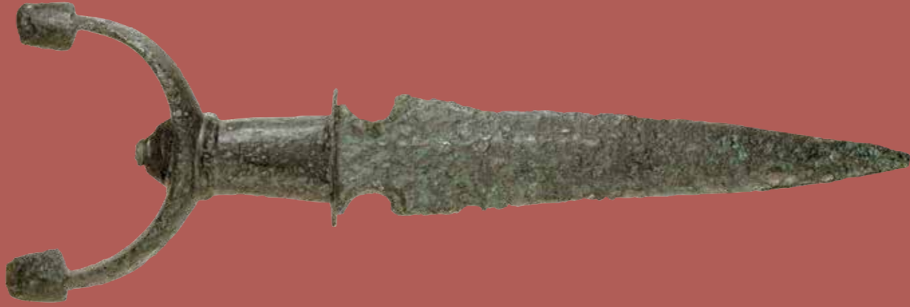
Puñal de antenas de bronce