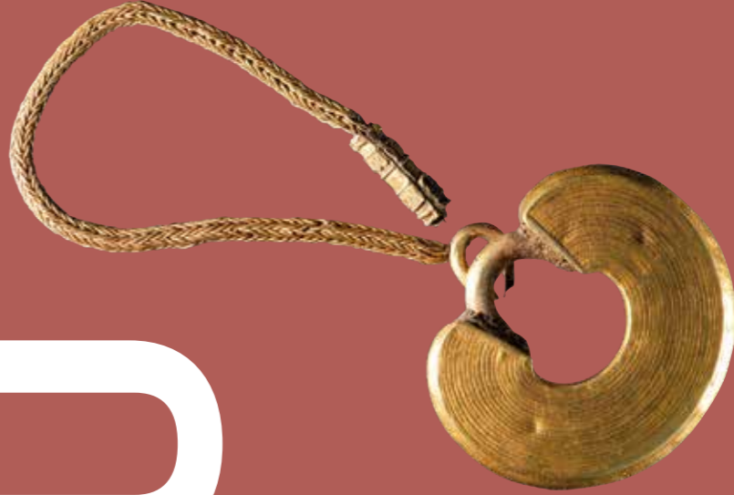
Arracada o pendiente con cadeneta