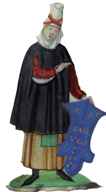
[Códice de indumentaria feminina]. Pergameo acquarelado. Anónimo. Entre 1530-1550.