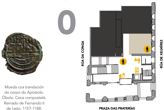
Moeda coa translación do corpo do Apóstolo. Óbolo. Ceca compostelá. Reinado de Fernando II de León. 1157-1188.

Iníciase o percorrido da planta baixa mostrando a peregrinación como unha práctica inherente ás crenzas do ser humano, presente en calquera época e en calquera lugar do planeta. As distintas culturas e as distintas relixións xeran formas diferentes de peregrinar que lle outorgan á peregrinación unha gran riqueza e variedade de expresións e producen pola súa vez obxectos rituais moi diversos e singulares.