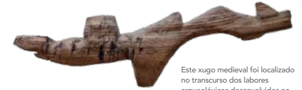
Este yugo medieval foi localizado no transcurso dos labores arqueolóxicos desenvolvidos no soar do edificio do museo durante a rehabilitación deste.

Mención especial merecen os restos arqueolóxicos exhibidos, tanto os atopados en Compostela coma os procedentes do Castelo da Rocha Forte , referente simbólico do poder feudal, e que explica a preponderancia da cidade no medievo baixo o señorío do arcebispo Compostelán.