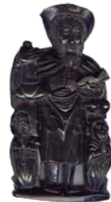
Santiago con orantes. Acibeche. Obradoiro compostelán. Entre 1476-1600. Procedente da colección da Familia real de Baviera.

Na terceira planta conclúe a visita cunha panorámica excepcional do conxunto histórico de Santiago, nunha pequena área de espacemento que permite o acceso á cafetería.